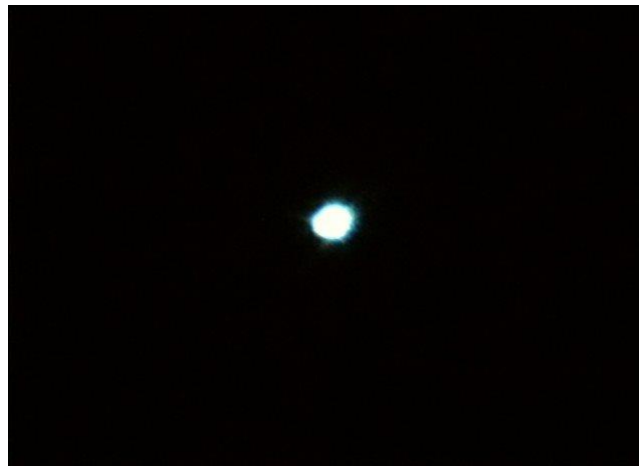
Εικόνα 3: ο αστέρας Βέγας στον αστερισμό της Λύρας (a Lyr), στον οποίο έχει ανακαλυφθεί η ύπαρξη περιαστρικού δίσκου

Ανάλογος είναι βέβαια και ο τρόπος δημιουργίας του ηλιακού μας συστήματος και των πλανητών, από την βαθμιαία συμπύκνωση και βαρυτική κατάρρευση ενός μεσοαστρικού νέφους αερίων και σκόνης, το οποίο περιστρεφόταν ταχύτερα στο κέντρο του. Ως αποτέλεσμα αυτής της περιστροφής η μάζα προς το κέντρο θερμαινόταν, με συνέπεια τη δημιουργία ενός πρωτοαστέρα αλλά και ενός περιαστρικού δίσκου (εικόνα 3).