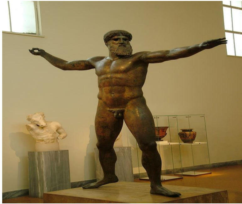
Εικόνα 1: ο Ποσειδώνας του Αρτεμισίου, από το Εθνικό Αρχαιολογικό Μουσείο Αθηνών (5 ος αι. π.Χ.)

Εκτός όμως του Ποσειδώνα, σχέση με το υδάτινο στοιχείο είχε και ο Ωκεανός, του οποίου το όνομα ετυμολογείται από τις λέξεις ώκυς νούς , που σημαίνει «γρήγορος νούς» (Πολίτης, 2004, σ.24). Ο Ωκεανός υπήρξε γιός του Ουρανού και της Γαίας αλλά και ο δυνατότερος εκ των Τιτάνων. Σύμφωνα μάλιστα με την ορφική εκδοχή της μυθολογίας ο Ωκεανός μαζί με την Τηθύν προέκυψαν από το σμίξιμο του Χάους και της Γαίας. Ο Ωκεανός και η Τηθύς με την σειρά τους σμίγουν ερωτικά και γεννούν τις Ωκεανίδες νύμφες που κατέχουν ολόκληρη την Γη και τα βάθη του Ωκεανού. Ο Ησίοδος μάλιστα ( Θεογονία , 349-370), παραθέτει και τα ονόματά τους ( Καλιρρόη, Πειθώ, Ρόδια, Ηλέκτρα, Γαλαζαύρη, Πληξαύρη, Τύχη, Ασία, Πλουτώ, Ωκυρρόη, Κερκηίς, Τελεστώ, Ουρανία, Ιππό, Πολυδώρα ). Η ένωση αυτή όπως φαίνεται, χαρακτηρίζεται από την ταχεία κίνηση που εκπροσωπεί ο Ωκεανός, με την όμορφη και αρμονική ροή που συμβολίζει η Τηθύς (εικόνα 1). Επομένως, το υγρό στοιχείο δεν είναι μόνο η αρχή της ζωής, αλλά χαρακτηρίζεται και από κάλλος.