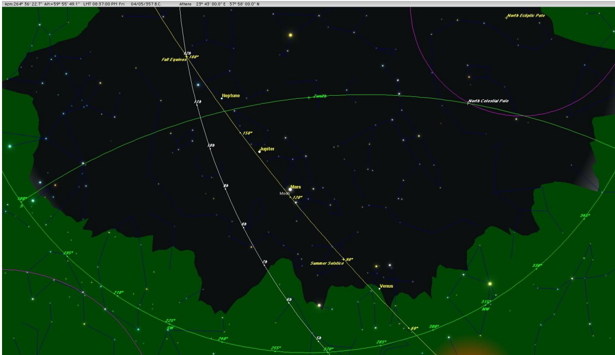
Όψη τοῦ οὐρανοῦ τῶν Ἀθηνῶν στίς 4 Μαΐου 357 π.Χ., 8:37 μ.μ.