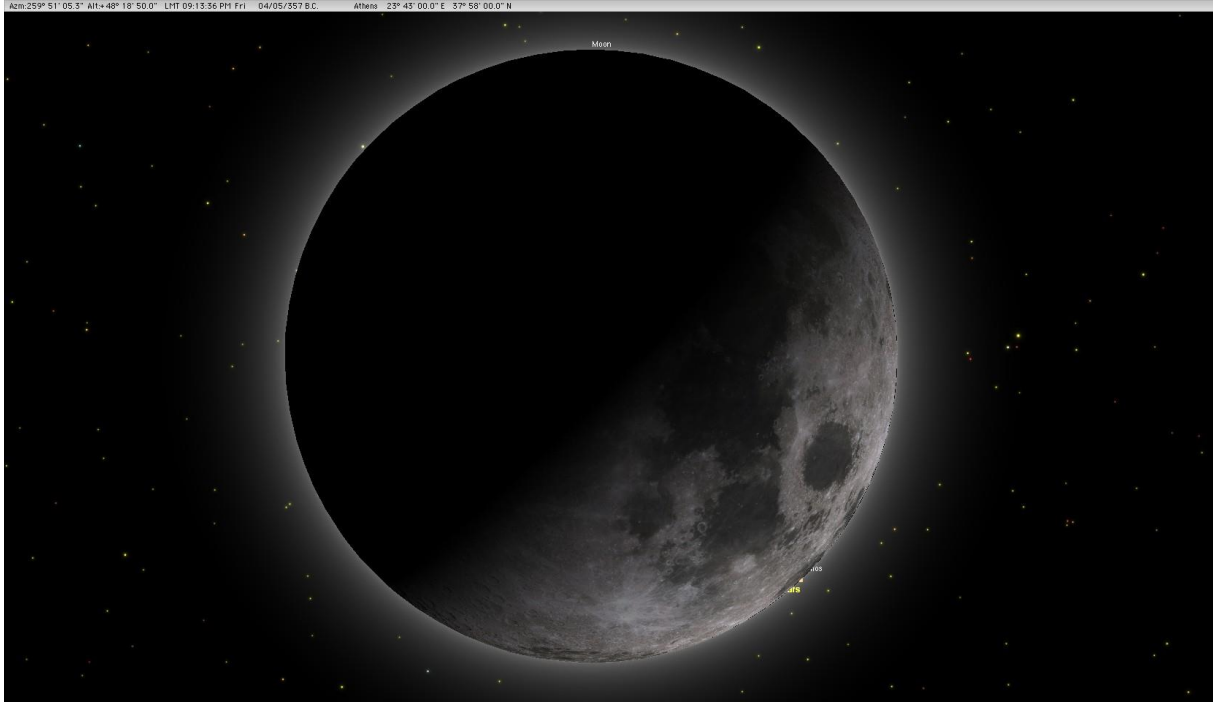
Τέλος τής επίπροσθήσεως (σε μεγέθυνση) στις 4 Μαΐου 357 π.Χ., 9:13:36 μ.μ.: Διακρίνεται ο κόκκινος Άρης κάτω δεξιά, στην περιφέρεια του σεληνιακού δίσκου.