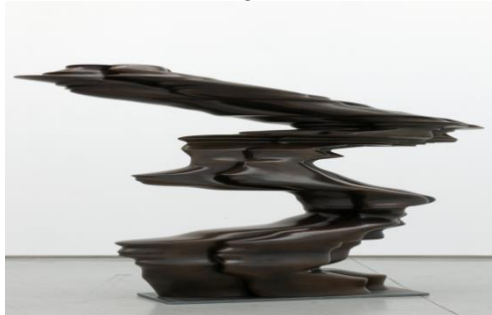
Red Figure, bronze, 2008, Charles Duprat (2)