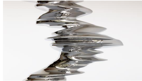
Elliptical Column_d_330x95x85_stainless steel_2012_Michael Richter (4)