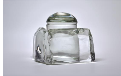
Untitled Glass, 2015, Michael Richter (4)