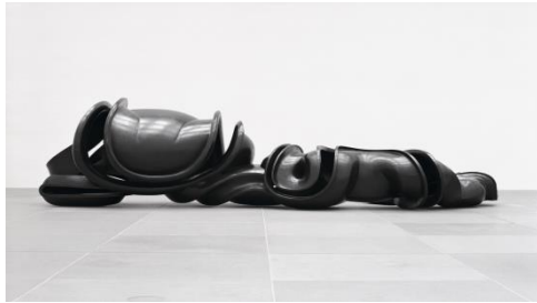
Early Forms a bronze 2001 Mario Gastinger (2)