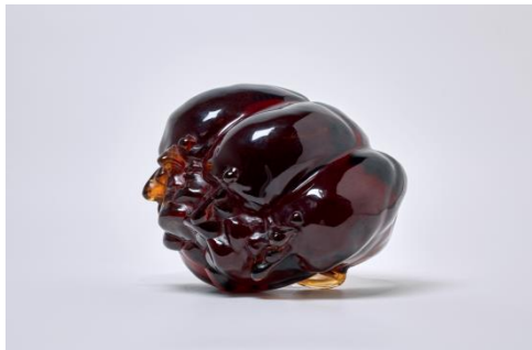
Untitled, Glass, 2015, Michael Richter