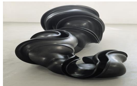
Early Forms bronze 2001